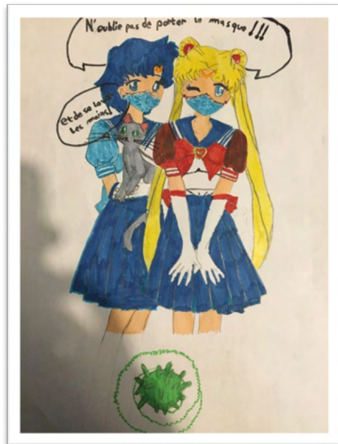
Le COVID illustré par Lalie